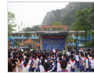
助力乡村振兴——云浮“三下乡”活动走进乡镇学校