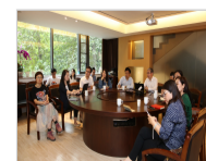
广东筹建罕见病工作委员会,专注罕见病保障政策和…