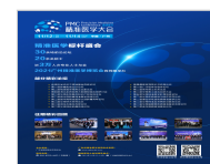
2021精准医学大会将于11月在广州举办,领航精准医…