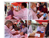
饶平县科协举办健康知识科普系列活动