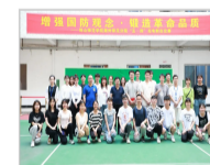
潮州市光电射击协会协助韩山师范学院潮州师范分院...