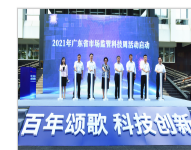
省科协领导出席2021年市场监管科技周活动