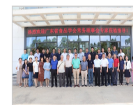
广东省食品学会第七届八次常务理事会议召开