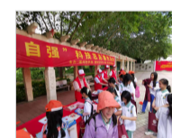
潮州市科协、潮安区科协举办“全国科技工作者日”...