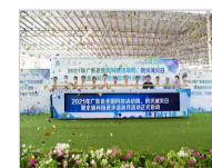
2021年广东省全国科技活动周、防灾减灾日暨全省科...